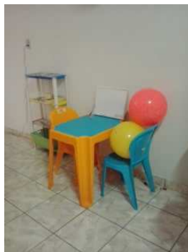
Parque das Crianças