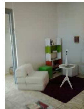
Pracinha do Demócrito