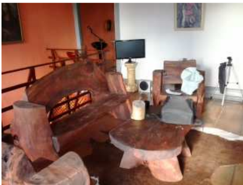
Sala dos Flintstones (hall de entrada)