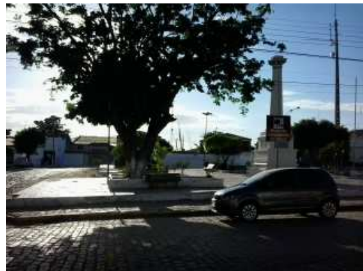
Pça da Independência (em frente à La BARCA)