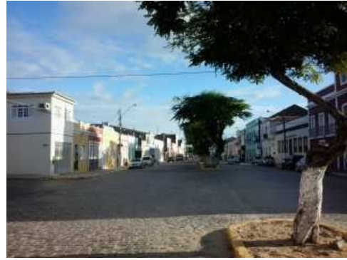
Vista da rua Larga (Boulevard Adolfo Caminha)