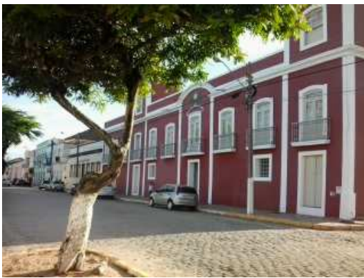
Câmara de Vereadores (em frente à La BARCA)