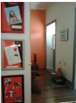
Retratos das Carolinas