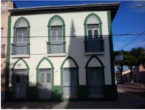
La BARCA, rua Larga 447, altos. Aracati.