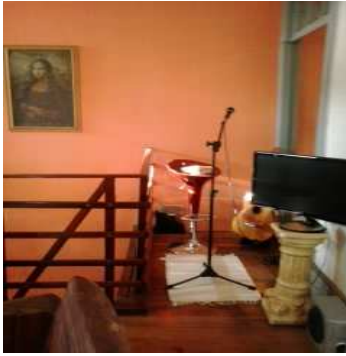
Cantinho da Música