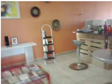
Café Cultural + Livraria