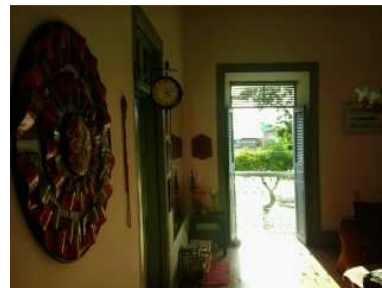
Vista a partir da "suíte do Rei"