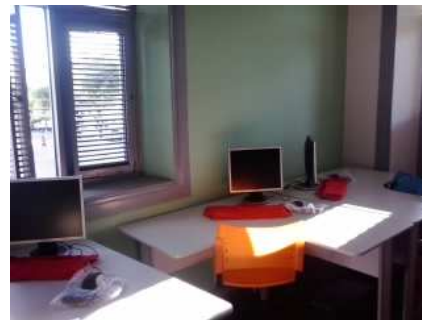
Aracati Digital (filiada ao Pirambu Digital)